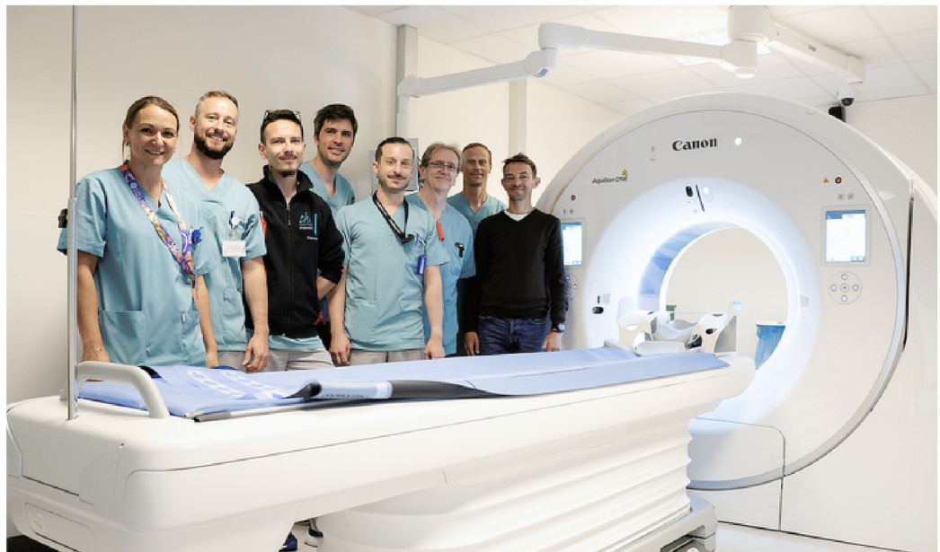
Une partie de l'équipe d'Imagerie médicale et de Canon Medical Systems

La dose de radiation délivrée aux patients lors de ce type d'examen est également nettement diminuée. Un investissement technique au service du patient et des professionnels du Centre Hospitalier de Mouscron.