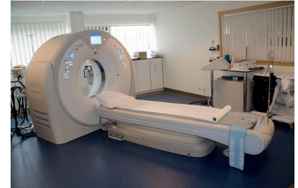
Salle de scanner

Aucun paiement ne sera à effectuer sur place, la facture sera directement envoyée à votre adresse.