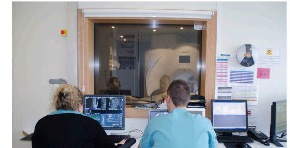
Console d'acquisition et de diagnostic / IRM

tunnel est parfaitement ventilé et aéré. Une équipe médicale se trouve derrière la vitre, elle vous voit, vous entend et vous indique l'avancement de l'examen. Vous pouvez l'appeler à tout moment à l'aide d'une sonnette. Plusieurs séquences de 3 à 5 minutes sont réalisées. Pour la parfaite netteté des images, et donc de la qualité de l'examen, il est très important de rester le plus immobile possible. Dans certains cas on vous demandera de ne pas respirer pendant quelques secondes. Pour certains examens, il faut injecter un produit de contraste (gadolinium) au niveau d'une veine du bras. Ce produit n'entraîne pas de sensation désagréable.